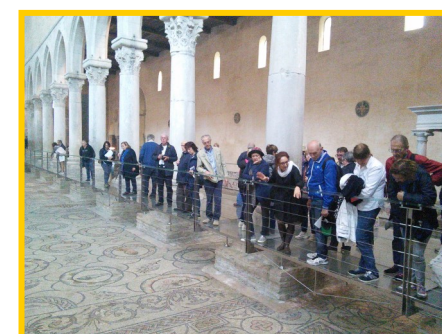
Aquileia museo archeologico e Basilica