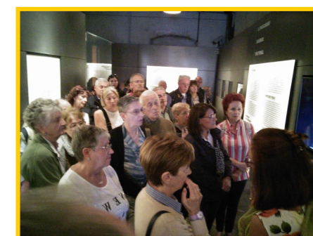
Risiera di San Sabba